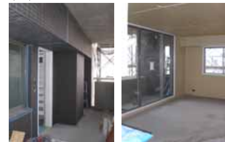
(工事状況：Aタイプ 201号室)