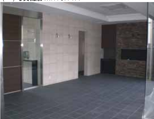
(エントランス・ラウンジ)