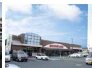
スーパー マルヨシセンター