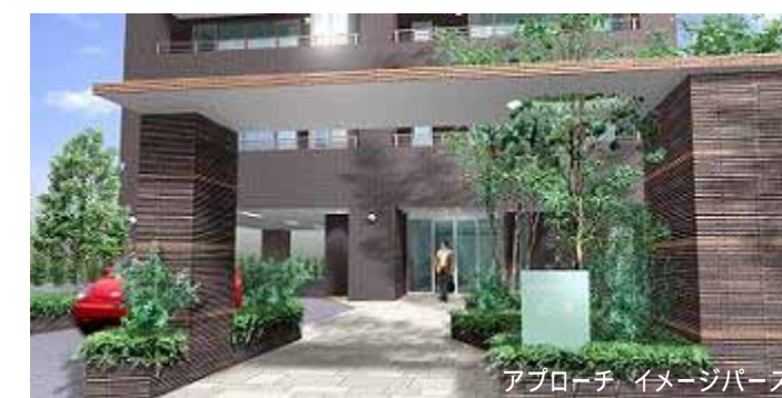
アプローチ イメージパース