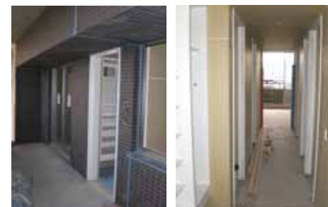
(工事状況：Bタイプ 202号室)

グランディアシリーズとして、初めて三津浜エリアで分譲を手掛けさせて頂いております『グランディア会津』(全26邸) 交通アクセスの良さやスーパー、公園にも程近い JR 三津浜駅前の利便環境は幅広い世代の方より好評を賜っております。