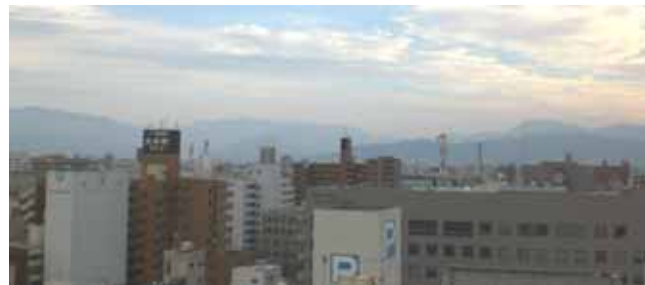
(Bタイプ1102号室から南面の眺望)

( ) 11月下旬より12月は完成に伴い、工事関係者ならびに入居者様で混雑が予想されます。その為、現地には十分な駐車場が確保できませんことを予めご了承下さいませ。千舟町マンションプラザへお越し頂けますと私共が現地までご案内させて頂きます。