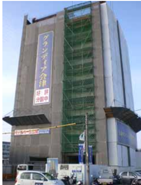
工事進捗：平成 20 年 1 月 15 日撮影

JR 三津浜駅前において建設中の「グランディア会津(全 26 邸)」。これまでお蔭様で順調に工事が進捗しており、本年 8 月の完成を予定しております。ちょうど完成の頃は、恒例の花火大会で賑わう時期ですので、もしかすると屋上スカイテラスから“三津の夏”を満喫して頂けるかもしれませんね。