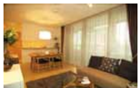
(リビングダイニング)