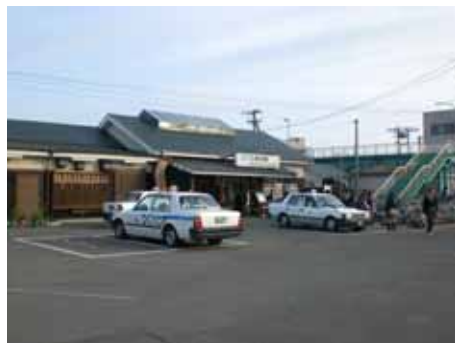
(JR 三津浜駅・下校の時間帯)

また、グランディア会津が位置する松山市の西部エリアには、港や空港などの中核的な交通拠点が在ることに加え、県立松山西高校や新田青雲中学、愛光学園などの中高一貫校が集まっていることも特徴的です。JR 三津浜駅前という利便性をプラスすると、通学エリアはさらに選択肢が広がり魅力的です。