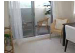
<ウェルカムテラスとして…>