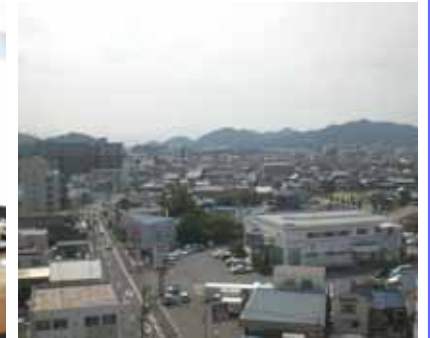
<モデルルームから南眺望>

新モデルルームでは、ご夫婦と犬1匹の3人家族(?)をコンセプトにインテリアのコーディネートさせて頂きました。趣味室やゲストルームなど、ある意味で優雅な生活のレイアウトが特徴ですが、是非ファミリー様にも、ご覧頂きたいお部屋です。