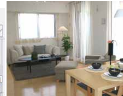
<リビングダイニング>