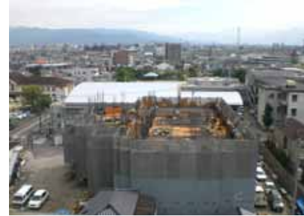
<工事進捗 H20.10.3 撮影>