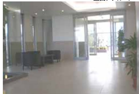
<エントランスホール>

太陽の日差しが心地よく感じられ、一年を通じて過ごしやすい季節を迎えました。振り返りますと昨年12月の小雪交じりの日に、工事中の協力を得て棟内モデルルームをオープンさせて頂きました。その後は春先の特別見学会、初夏の地域優待会、現在の完成見学会と、市内外より多くのお客様にご来場を頂きまして、心より感謝致しております。