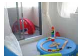
<キッズテラスとして…>

グランディア会津の玄関前（アルコーブ）は、背の高い門扉により、戸建て感覚に近いプライベート性と開放的なオープンスペースのしつらえが特徴的。ご家族や知人と寛ぐスペースとして、または花木のご趣味を楽しむスペースとしてなど用途も様々。マンションでありながら、これだけ広く明るい玄関は、きっと他には無い快適性をご実感いただけます。